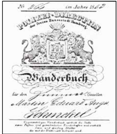
altes Wanderbuch von 1853

die AOK Hamburg zuständig. Die GEK ist eine Arbeiter-Ersatzkrankenkasse, die am 1.7.2008 mit der Hamburgischen Zimmererkrankenkasse fusionierte. Vorher waren die rechtschaffenen fremden Gesellen fast ausschließlich in dieser Kasse versichert. Sie gewährt als Krankenkasse den ausreichenden Krankenversicherungsschutz. Für die reisenden Gesellen empfiehlt es sich, ein Konto einzurichten, welches natürlich zu jeder Zeit ausreichende Deckung haben sollte. Die Beiträge werden dann von der Krankenkasse abgebucht. Somit ist gewährleistet, dass der reisende fremde Geselle krankenversichert ist.