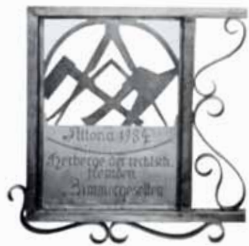
Fliegendes Herbergsschild der rechtsch. frd. Zimmerer zu Altona 1984