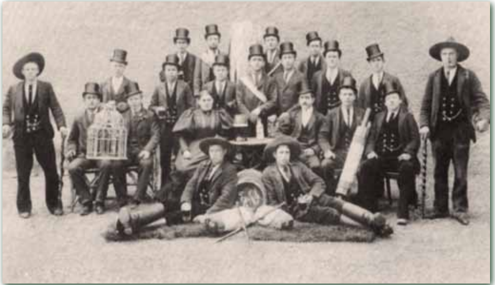
Gesellschaftsbild Winterthur 1896