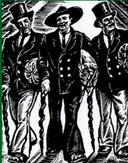
Zureise auf der Herberge