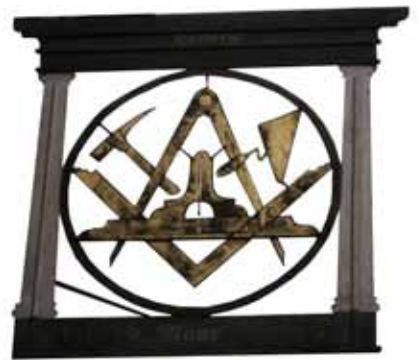
Fliegendes Herbergsschild der rechtschaffenen fremden Maurer und Steinhauer zu Kiel

In den Wintermonaten wird er zusätzlich noch einen Tag kostenlos gepflegt. Beim Kommodeheißer kann er sich nach den Arbeitsmöglichkeiten vor Ort erkundigen und erfährt, welche Gesellen in der letzten Zeit mit welchem Ziel durchgereist sind und wer in der Stadt in Arbeit steht. Die Herbergen sind sozusagen das Zuhause der reisenden Gesellen, in denen der Wirt auch mit Vater, die Wirtin mit Mutter und die Söhne und Töchter,