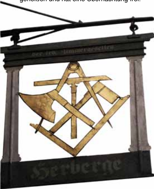
Fliegendes Herbergsschild der rechtschaffenen fremden Zimmer- und Schieferdeckergesellen zu Kiel.

In den Herbergen sind aber nicht nur die reisenden Gesellen Zuhause, sondern es finden sich hier auch die einheimischen Fremden zu den verschiedensten Anlässen ihrer Gesellschaft wie Gesellen-, Schaller-, Trudel- oder Modellierabend etc. ein.