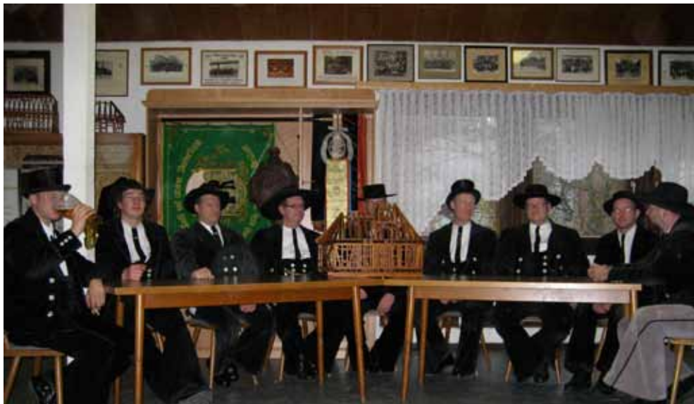
Gesellen am Gesellentisch

Der Gesellenabend findet für reisende Gesellen wöchentlich und für Einheimische alle vier Wochen an einem Wochenende ab zwanzig Uhr statt.