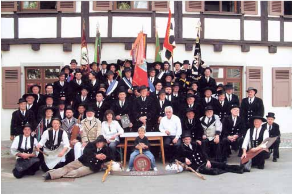
Fahnenweihe - Ravensburg 2005

Jede Gesellschaft ist für sich selbständig und wird bei den rechtschaffenen fremden Zimmer- und Schieferdeckergeesellen von einem Alt-, Buch- und Dosengesellen und bei den rechtschaffenen fremden Maurer- und Steinhauergeesellen von einem Wortführer, einem Herbergs- und einem Krankenbesucher geführt.