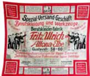
Charlottenburger „Fritz Ulrich“

Auf der Wanderschaft hat der reisende Geselle sein gesamtes Hab und Gut mit einer besonderen Technik und Geschick – was eben nur bei den fremden Gesellen zu erlernen ist – zu einem Charlottenburger gebunden. Er hat die Form einer riesigen ca. dreißig Zentimeter dicken und siebzig Zentimeter langen Wurst und beinhaltet das notwendigste Werkzeug, Arbeitszeug, Unterwäsche und Hemden sowie Wasch- und Schuhputzzeug. An einem akkurat gebundenen Charlottenburger erkennt man in der Regel auch den akkuraten zünftigen Gesellen.