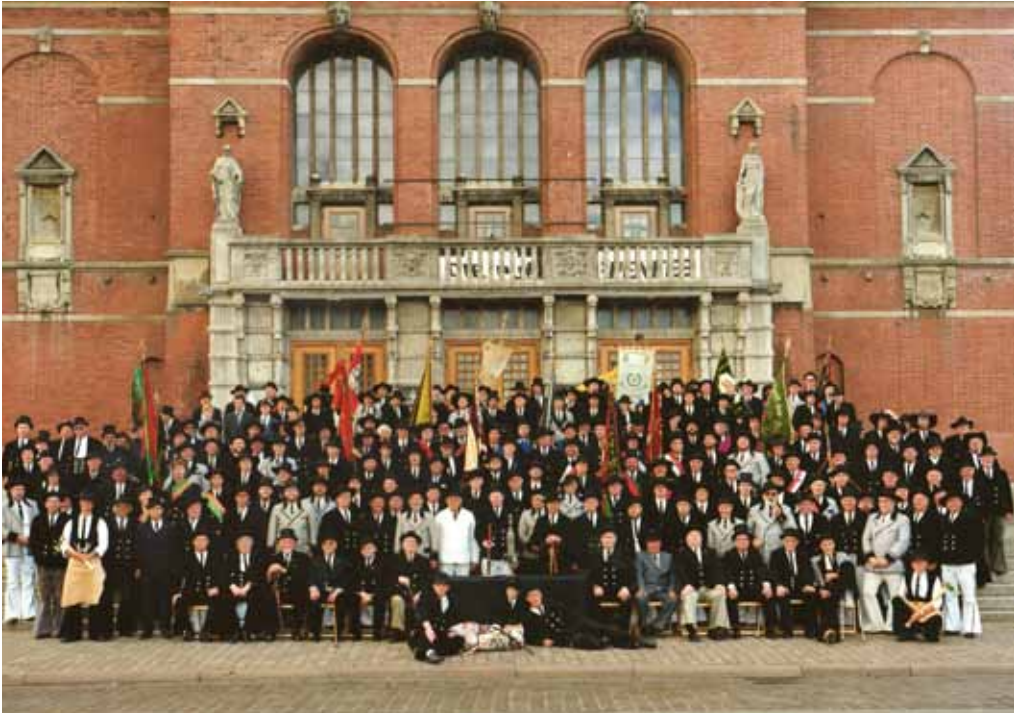
Himmelfahrtstreffen 1990 zu Kiel

Turnusmäßig wiederkehrende Veranstaltungen sind bei den rechtschaffenen fremden Gesellen international, die jährlich abgehaltenen Europatreffen. Auf Vereinigungsebene, alle vier Jahre der Kongress und das jährlich in einer anderen Gesellschaft stattfindende Himmelfahrtstreffen.